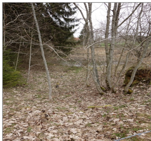
La mare complètement envahie par la végétation

La mare du Peu Péquignot : un endroit connu qui nous est cher. Malheureusement, on y déplore la rareté de l'eau, pour ne pas dire son absence !