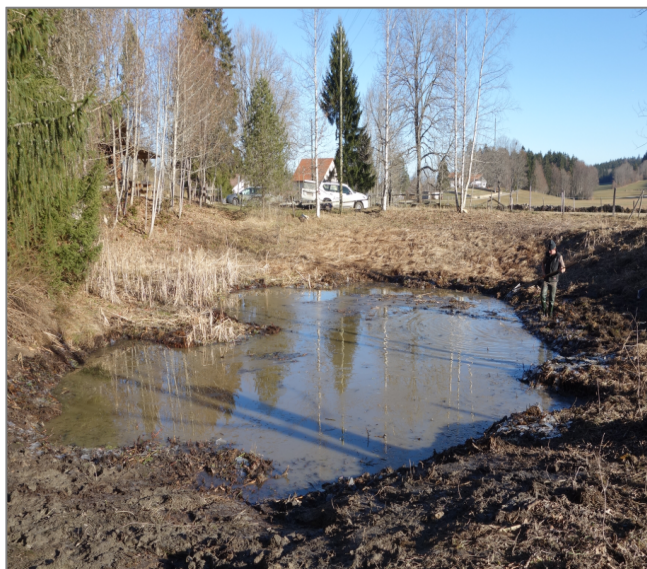
Une mare toute neuve, ce 14 décembre, juste après le dégel matinal !

On ne retrouvera pas l'étang au bord duquel certains d'entre nous se souviennent d'avoir pêché mais une jolie mare tout de même !