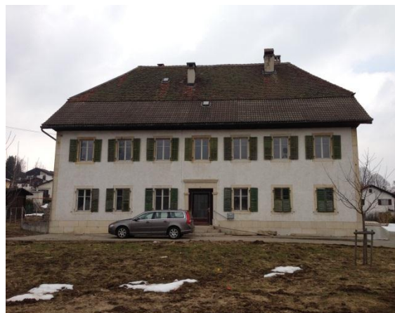
Bâtiment Rue des Colverts qui abritera la nouvelle structure

Pour commencer un sondage a confirmé ce besoin et les autorités communales ont été rencontrées en juillet 2012. Le conseil communal de l'époque a souhaité un dossier « ficelé », avec des préinscriptions et informé qu'il n'y avait pas de locaux à disposition appartenant à la Commune.