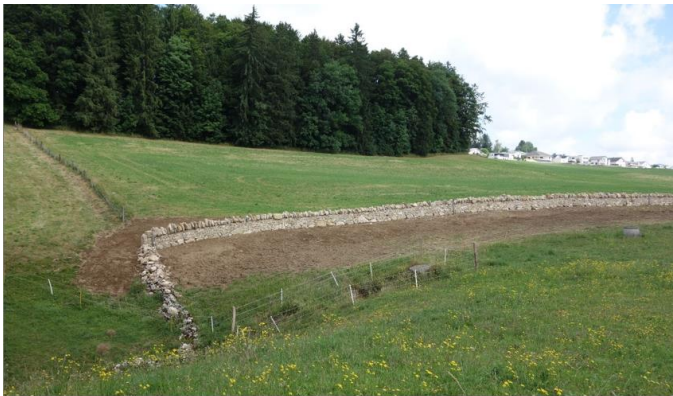
Le mur des Esserts à la fin des travaux, en juin de cette année. Pas moins de 125 m de mur remis à neuf !

Dans le Noirmont info de décembre 2021, la compensation "légale" au défrichement nécessaire à la construction de l'usine DETECH 3 était présentée. Cette plantation d'une nouvelle forêt (de compensation) va croître gentiment... patience !