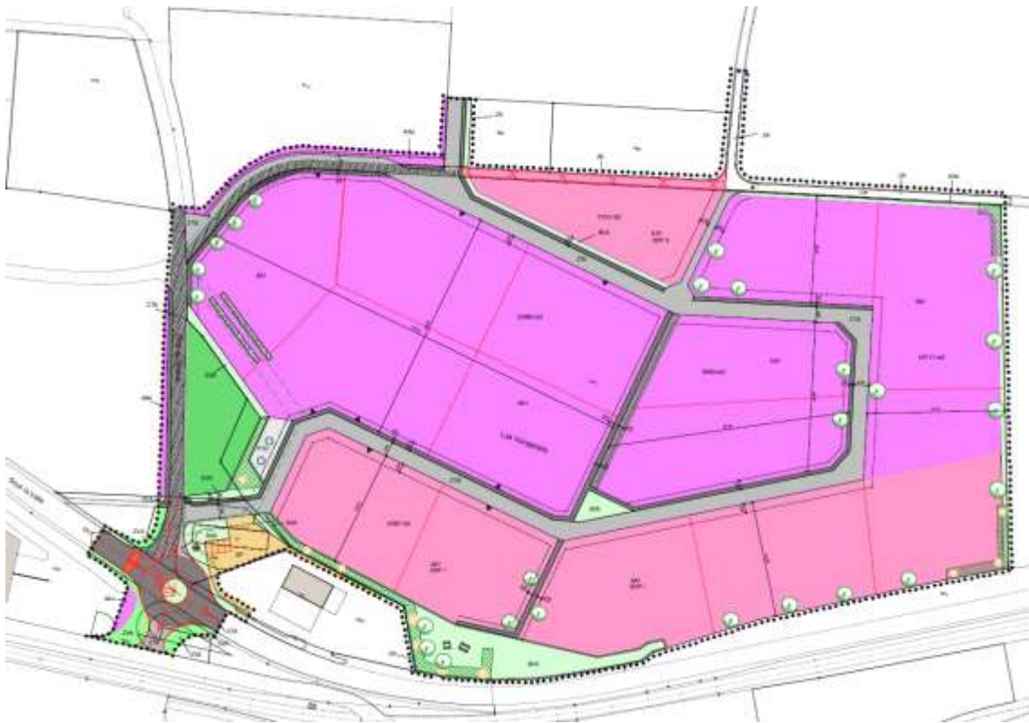
Extrait du plan spécial régional en cours d'étude