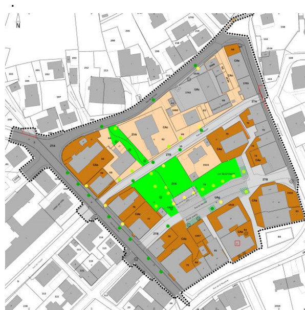
Extrait du projet de plan spécial (plan d'occupation du sol)

Le projet prévoit la création d'un espace public central convivial, polyvalent et intergénérationnel avec une surface verte généreuse et arborisée. Il comprend un couvert permettant l'organisation de manifestations diverses (marché, concerts, spectacles, etc.) ainsi qu'une place de jeux.